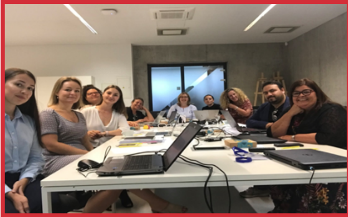
Η τρίτη διεθνής εταιρική συνάντηση πραγματοποιήθηκε στις 29 Αυγούστου 2019 στο Κάουνας της Λιθουανίας